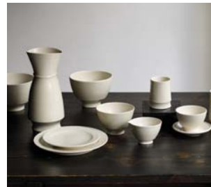
(左)花坂陶石のテーブルウェア／谷口製土所「HANASAKA Une シリーズ」

石川県の小松、山中、富山県の高岡などの伝統産業、服飾雑貨や食品関連など地域を活かしたプロダクトデザインをはじめ、ブランディング、店舗や展示会ブースのデザインなど幅広く携わっている。