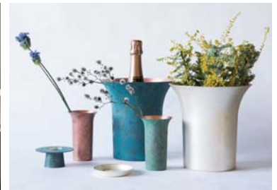
(右)銅の色を楽しむ暮らしの道具